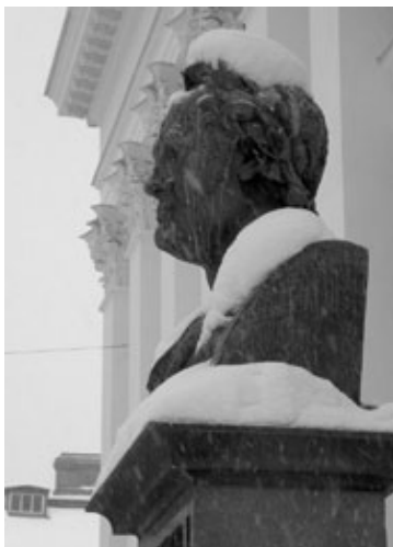
Aleksanterin pysti nököttää tuulessa ja tuiskussa.

Nyt on Historian Ystävien luki-joilla mahdollisuus ottaa asiaan