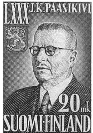
J. K. Paasikivi johti Historian Ystävien Liittoa 20 vuotta