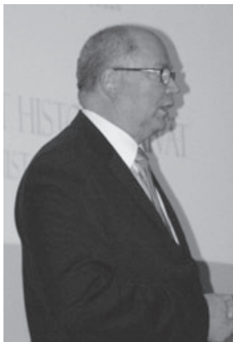
Puhemies Eero Heinäluoma vastustaa historian opetuksen valinnaisuutta

”Suomalaista yleissivistystä ei saa vaarantaa. Yleissivistävä koulu on hyvien opettajien ohella yksi